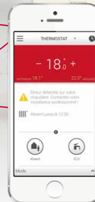
Rappel des besoins de maintenance